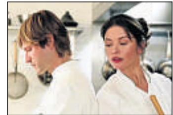
Stress in der Küche: Aaron Eckhart und Catherine Zeta-Jones

Von Alain Delon zu Matt Damon: In Patricia Highsmiths Roman „Der talentierte Mr. Ripley“ ermordet ein Hochstapler einen reichen jungen Mann und lebt dessen Leben weiter. Die Ur-Filmfassung von 1960 stammt von René Clément und kam unter dem Titel „Nur die Sonne war Zeuge“ ins Kino. Anthony Minghella verpflichtete Matt Damon, Jude Law und Gwyneth Paltrow.