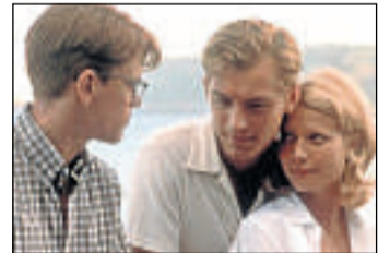
Trio: Matt Damon (links), Jude Law und Gwyneth Paltrow.

Felix Gary Gray nahm sich 2003 den britischen Film „The Italian Job - Charlie staubt Millionen ab“ von 1969 vor und verfilmte ihn unter gleichem Titel neu. Mark Wahlberg, Donald Sutherland, Charlize Theron und Jason Statham spielen in dem actionlastigen Gangsterfilm um einen Goldraub. Höhepunkt in beiden Filmen ist eine Verfolgungsjagd mit Minis.