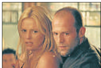
Action im Zentrum: Charlize Theron und Jason Statham.

Nicolas Cage und Meg Ryan spielen in Brad Silberlings „Stadt der Engel“, der 1998 als Remake von Wim Wenders „Der Himmel über Berlin“ (1987) herauskam. Zwar ist auch hier, in Los Angeles, der Stadt der Engel, ein Engel unzufrieden mit der Ewigkeit und wird Mensch, in der US-Fassung steht aber die tragische Liebesgeschichte viel mehr im Zentrum als bei Wenders.