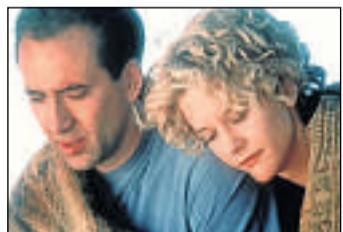
Engel trifft Chirurgen: Nicolas Cage und Meg Ryan.